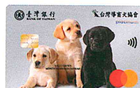
▲一卡通導盲犬認同卡