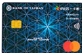
▲一卡通鈦金商旅卡